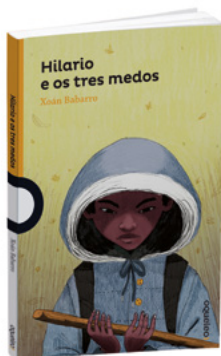
Hilario e os tres medos Xoán Babarro