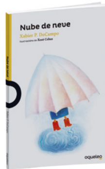
Nube de neve Xabier P. DoCampo