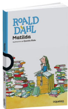
Matilda Roald Dahl