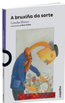
A bruxiña da sorte Concha Blanco