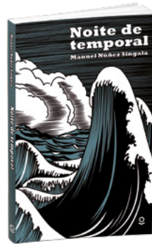
Noite de temporal Manuel Núñez Singala