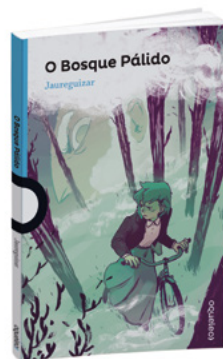
O Bosque Pálido Jaureguizar